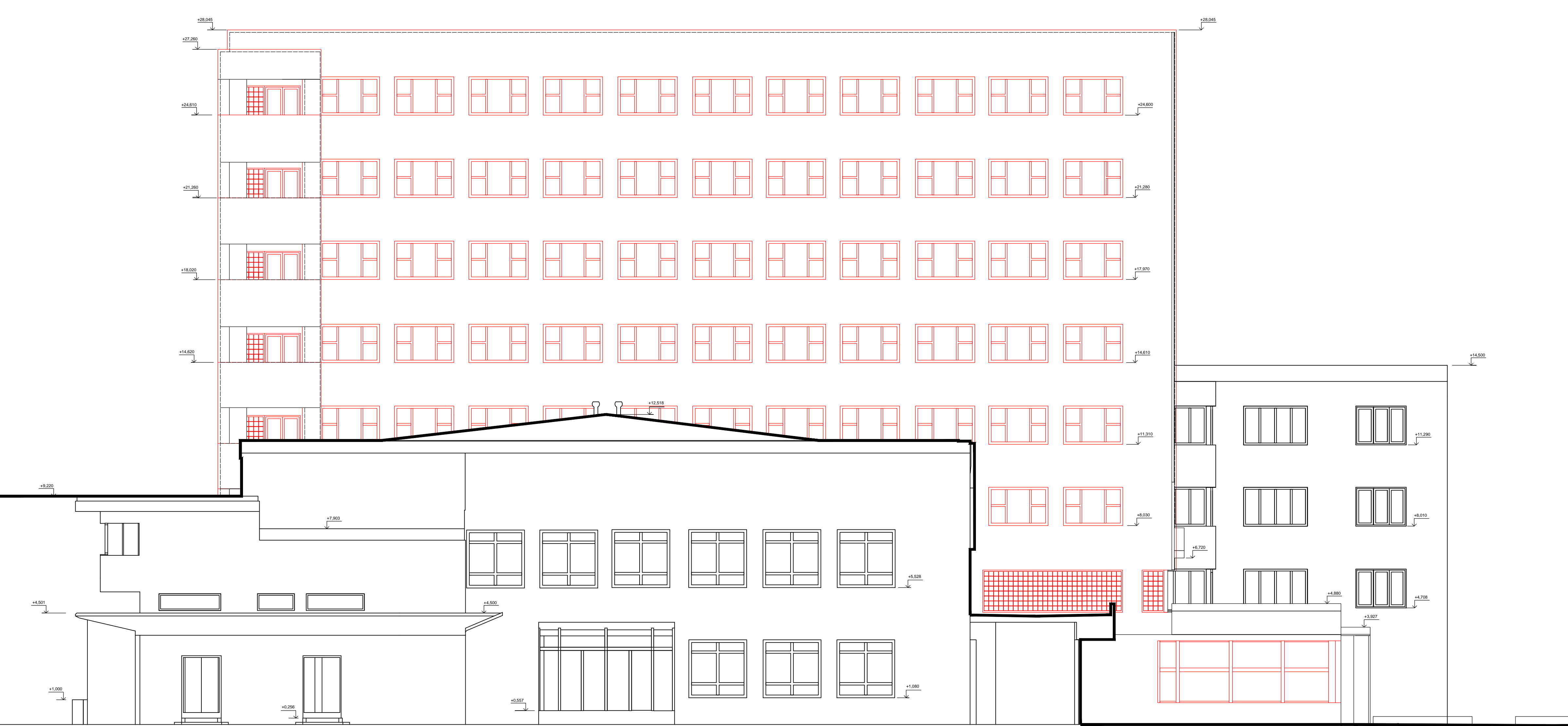
Východní pohled - nový stav