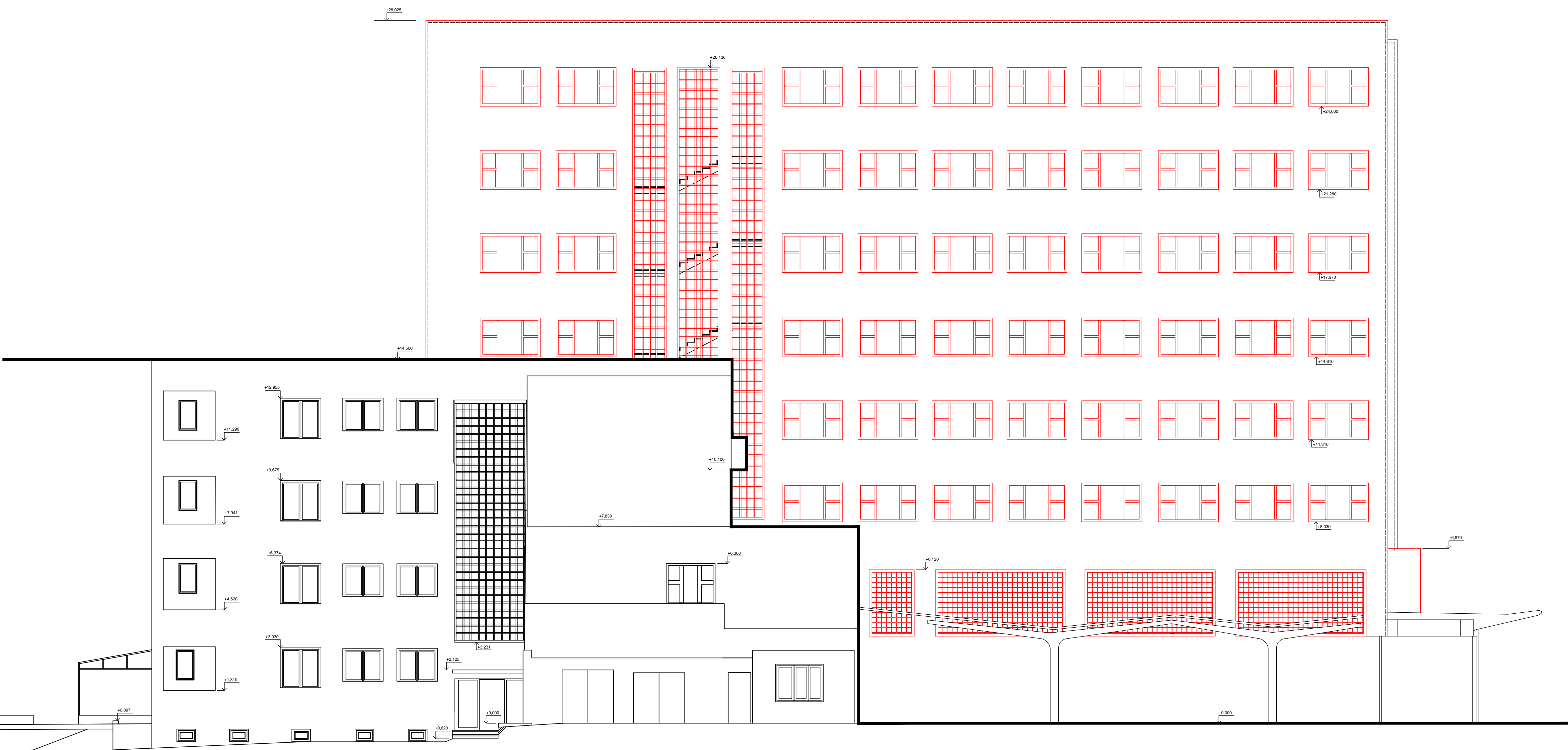
Západní pohled - nový stav